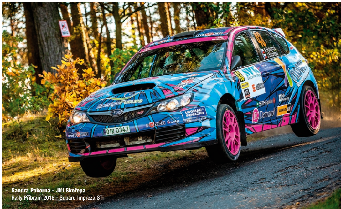
Sandra Pokorná - Jiří Skořepa Rally Příbram 2018 - Subaru Impreza STI

Na Sandru letos čekala velká výzva. Po loňském testovacím startu na Rally Příbram úspěšně pokračovat v sériálu MČR v rally. Dvoudenních, mnohem náročnějších, závodech, které navíc pro ni byly zcela neznámé. „Proti sprintům to byl obrovský rozdíl. Loňská Příbram něco naznačila, co nás asi bude čekat, ale realita byla ještě těžší. Na začátku sezony jsem se vyrovnávala s povahou soutěží, byly mnohem náročnější, techničtější, samozřejmě i delší. Nejen z pohledu kilometrů, ale i času. Loni jsem za den odtrénovala sprint a den závodila, najednou to byly dohromady čtyři dny. Vše bylo fyzicky náročnější. Bylo potřeba se více zaměřit na fyzickou, na jídelníček v průběhu závodů, aby mi nechyběla energie. Strašákem byly i noční erzety, které jsem do té doby absolvovala tak dvě, ale s tím jsem se také postupně popasovala,“ říká k úspěšné sezoně usměvavá blondýnka.