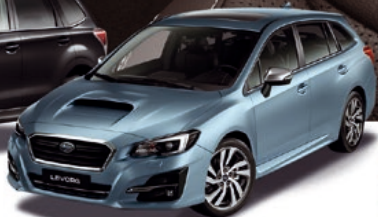
LEVORG AWD sportovní kombi