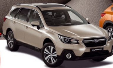
OUTBACK AWD crossover s nadhledem