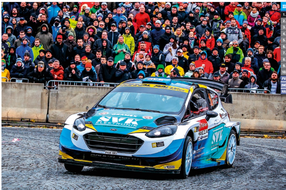
XXIII. TIPCARS PRAŽSKÝ RALLYSPRINT 2017