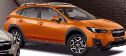
XV AWD městský univerzál

Navštivte nás na subaru.cz, zazijsubaru.cz a subaru-butik.cz!