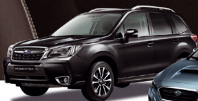
FORESTER AWD opravdové SUV

Permanentní pohon všech kol Symmetrical AWD v základu. Jízda v Subaru je ideální kombinací pohodlí a bezpečnosti. Nová pevnější platforma vám dovolí ještě ostřejší průjezdy zatáčkami. Nepřekonatelná jistota bez ohledu na počasí a roční dobu – na okresce i na dálnici.