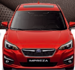
IMPREZA AWD ikona